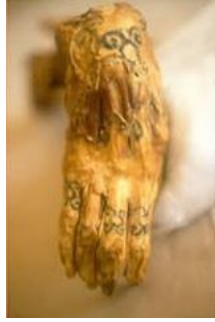
Resim 1. Ammont el dövmesi (Samani, 1389)

Susa bölgesinde bulunan Hammurabi yasalarını içeren taş tablet, dövme konusunda bilinen en eski belgedir. Hammurabi kanununun maddelerinden birinde; “Bir kimse, kölenin vücuduna, sahibinin ve efendisinin izni olmadan satmasını engelleyecek şekilde dövme yaparsa, dövme yaptıran kişinin parmakları kesilmelidir” yazmaktadır. Ayrıca 227. maddeye göre “Eğer bir damgacı aldanır ve başkasına ait olan bir kölenin vücuduna affedilmez ve satılmasına engel olacak bir işaret damgalarsa, bilerek damgalamadığına dair yemin etmeli ve aldatan kişiye mahsus olan ceza onun hakkında uygulanmamalı.” (Samani, 2011).