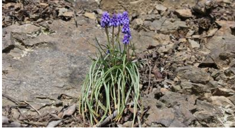
Şekil 2: Bugün sünbül olarak adlandırdığımız bitkiler ile Ortaçağ’da sünbül olarak bilinen bitkiler farklıdır. Günümüzde, gavur sünbülü, ermeni sünbülü, arap sünbülü, dağ sünbülü ve üzüm sünbülü adları ile bilinen Muscari armeniacum taksonu, başak formundaki çiçek durumu yahut misk benzeri kokusu ile sünbül adını devralmış olabilir.

Halîmî (XV. yy.)’ye göre, sünbül adını taşıyan üç farklı bitki mevcuttur. Bunlar, sünbül-i hindî ya da sünbül-i tayyib, sünbül-i rûmî ve sünbül-i ikli’tîdir. Ona göre, bu üç bitkinin yanı sıra, koku ve tıbbi kullanım benzerlikleri nedeniyle başka bitkiler de sünbül olarak bilinmektedir (Uzun, 2005: 192). Ankaravî (XV. yy.), sünbületü’t-tayyib ya da hindî ile sünbül-i rûmî