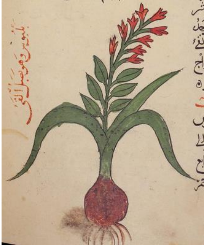
Şekil 4: Gâfiki (ö. 1165)'nin Kitâb fi el-Edviye el-Müfreda adlı eserindeki muhtemel bir Muscari çizimindeki tipik başak çiçek durumu yapısı. Abū Ja'far Aḥmad ibn Muḥammad Ghāfiqī. Kitâb fī al-adwiya al-mufrada . Québec: Osler Library, Manuscript, B.O. 7508. vr. 73a.

Ortaçağ Türkçe bitkibilim terminolojisine göre sünbül yahut sünbüle, buğday ve arpa başaklarının adıdır ve Türkçe karşılığı olarak salkım, başak ve ekinbaşı kelimeleri verilmiştir (Uzun, 2005: 192; Arslan, 2016: 47; Kumanlı, 2016: 25; Aymelek, 2015: 165). Bu terim modern bitkibilimde spicatus olarak bilinir ve bitkinin uzamış ve dalsız olan ana gövdesindeki sapsız çiçeklerin oluşturduğu çiçek durumunu karşılar (Wofford, 1989: 15). Buğday ve arpa gibi türler bu tanıma uygundur ancak bizim bir önceki bölümde gösterdiğimiz sünbül türlerinin çiçek durumları çoğunlukla talkım halindedir. Öte yandan hem buğday ile arpa hem de Ortaçağda sünbül olarak bilinen bitkilerin başak formunda çiçek durumları oluşturmaları bakımından ortaktır. Bu durumda ise sünbül kavramının, bu yapıyı