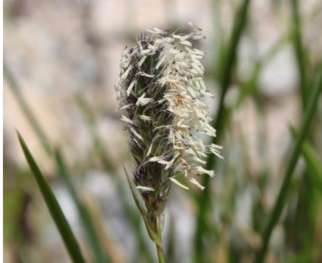
Şekil 5: Sarı saçları rüzgarda dalgalanan Demeter yahut buğdaygillerin tipik başak yapısını sergileyen Sesleria alba .

Türk şiirinde sünbül kavramının işaret ettiği kavram için en güçlü olasılık, bizce Antikçağ'ın uzun boylu ve uzun saçlı olarak tasvir edilen tarım tanrıçalarının şiirde karşılık bulmuş halidir. Bu tanrıçalar, Antikçağ insanı için hayati öneme sahip olan ekinlerin tohumdan hasat aşamasına kadar olan süreci kontrol etmeleri ile cisimleştirilmiştir ve insanoğluna hem ekin yetiştirmeyi öğretip hem de ekinlerin olgunlaşmasını sağlayarak onları beslediği için, daha düz bir ifade ile eğiten, gözeten ve besleyen nitelikleri ile başlangıçta ideal anne, sonrasında da ideal sevgili tanımına evrilmiştir. Doğallıkla şiirimizdeki sünbül kullanımında işaret edilen sünbül kavramı ile kastedilenler arasında, önce