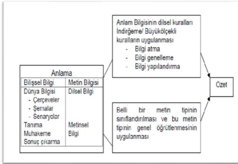
Şekil 8. Özetleme Tekniğini Oluşturulması, Kaynak: (Ülkü 2002: 62).

Ülkü (2002) ise özetlemeyi öğrencilere öğretilmesini bir şema ile göstermektedir. Şekil 10'da metnin detaylı olarak anlaşılması gelmektedir. Metnin anlaşılması veya çerçeveleme özetlemenin ilk adımı olarak görülmektedir. Sonrasında gerekli veya gereksiz bilgilerin silinmesi, genelleme yapılması gibi pek çok süreçten geçen özet oluşmaktadır.