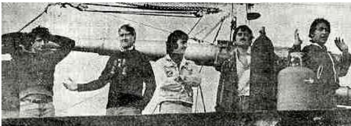
Prisoners taken after the Invasion in 1978

Diğer yandan Sealand'ın devletin varlık şartları anlamında en çok zorlandığı unsur diğer devletlerle ilişki kurabilme yetkinliğidir (Grimmelmann, 2012: 471). Hukuki olarak herhangi bir devlet tarafından tanınmayan Sealand'ın, bazı devletlerle girdiği ilişkiler sebebiyle de facto şekilde tanındığı öne sürülmektedir. Örneğin 1978 yılında bir grup insan, Sealand'ı ele geçirmek amacıyla Roughs Tower 'ı işgal girişiminde bulunmuşlardır. İlk olarak Sealand'ı ele geçiren bu kişiler daha sonra Sealand vatandaşları tarafından etkisiz hale getirilerek alıkonulmuştur. Bu gelişme sonrası Hollanda ve İngiltere yetkilileri, ilgili kişilerin serbest bırakılması için bazı girişimlerde bulunmuştur. Hatta Almanya da bu amaçla, Sealand'a resmi bir diplomat göndermiştir (Conway, 1981: 7).