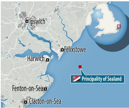
Şekil 1: Sealand'ın coğrafi konumu

Uluslararası hukuk, bireylerin uluslararası bir tüzel kişiliğine sahip olmadığı için, bir şahsın kendisi için toprak edinip kazanamayacağı konusunda tatmin edici bir cevap vermemektedir (Horn, 1973: 533). Bu bağlamda uluslararası hukuk, bir toprak üzerinde etkili bir kontrol sağlandığı takdirde toprağın nasıl kazanıldığı konusunda kayıtsız kalmaktadır (Jennings, 1963: 4). Uluslararası hukuk açısından res nullius durumunda olan Roughs Tower platformu, işgale uygun bir durumdadır. Zira hem açık denizde bulunmakta hem de herhangi bir devletin egemenliği dışındadır. Dolayısıyla Roy Bates'in platforma çıkıp burada bir egemenlik hakkı iddiasında bulunmasına uluslararası açıdan bir engel bulunmamaktadır. Platformun 50 yılı aşkın bir süredir Roy Bates ve ailesinin kontrolünde olması da, Platform üzerinde etkin bir kontrol sağlandığını ortaya koymaktadır.