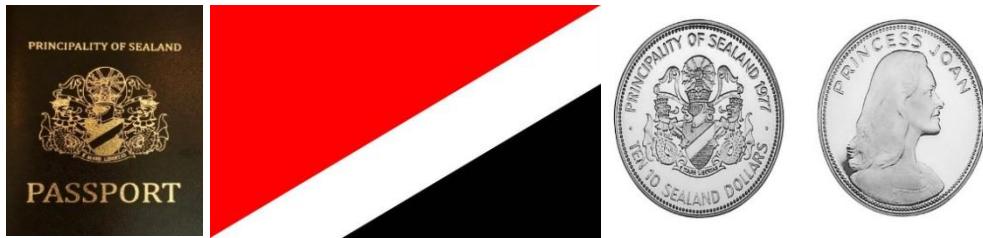
Şekil 5 ve 6: Sealand pasaportu, bayrağı ve parası

İnternet sitesindeki verilere göre kendisine ait bir para birimi kullanan Sealand, 1969 yılında pasaport vermeye başlamıştır. Sealand Prensi, 1975 yılında bir Anayasa ilan ederek, diğer devletlerden bağımsız olarak kendi kaderini tayin edebilecek, iç ve dış konularda karar verebilecek bir siyasal sistem kurmuştur. Bu açıdan Sealand, kendi egemen yetkisi ile içerde ve dışarda bir kamu otoritesinin normal işlevlerine sahip görünmektedir (Vitanyi, 1978: 15-18). Bu durum Sealand'ın kuruluşundan bugüne kadar devam etmektedir.