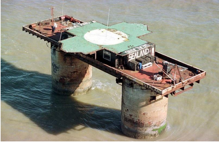
Şekil 2: Roughs Tower platformu

Uluslararası hukukta kabul edilen yaygın görüşe göre bir devletin ülkesi kara, deniz ve hava unsurlarından oluşmaktadır (Kaya, 2016: 67). Kara ülkesi devletin varlığı için temel unsurdur. Zira deniz ve hava ülkeleri kara ülkesinin varlığına bağlıdır. Kara ülkesinin bir kara parçası ya da en azından bir adadan oluşması gerekmektedir. Bununla birlikte kara parçasının veya adanın büyüklüğü ve coğrafi yapısı devlet unsurları açısından önemli değildir. Ancak yılın belirli dönemlerinde insan yaşamına uygun hale gelen ve bu durumun süreklilik arz etmediği kara parçaları ya da adalarının kara ülkesini oluşturması mümkün değildir (Bozkurt vd. 2021: 79). Sonuç olarak kara ülkesi de insan topluluğu gibi sürekli nitelikte olmalıdır.