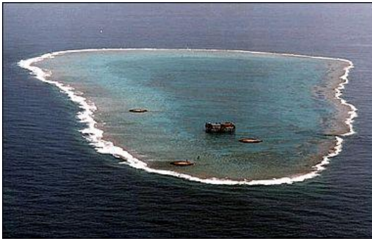
Şekil 3: Minerva Devletinin kurulmak istendiği mercan kayalıkları