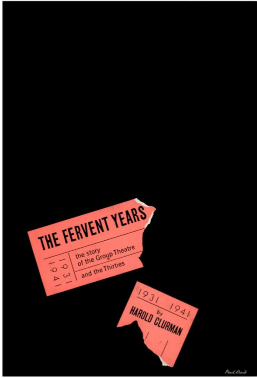
Şekil 3. Paul Rand tarafından tasarlanan “The Fervent Years” kitap kapağı Kaynak: Paul Rand Design Archive